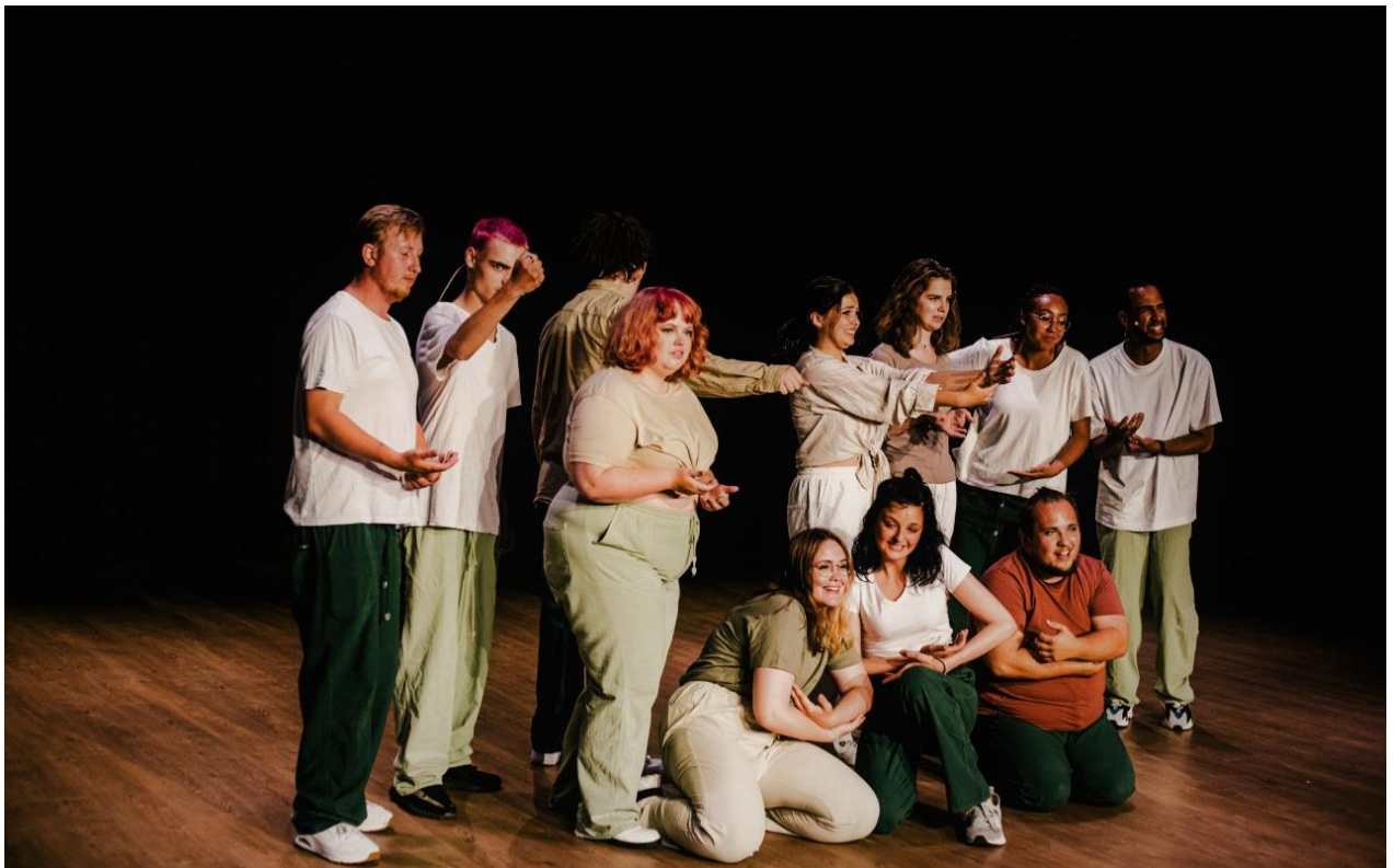
TjillSkillz Dans en Theater voor Jongeren